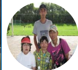
パークゴルフ大会 8月28日